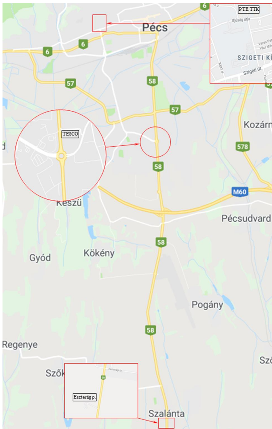
2. térképvázlat: Találkozási pontok a terepi napon

8:00 Buszokkal indulás a szelvényekhez a TESCO parkolóból