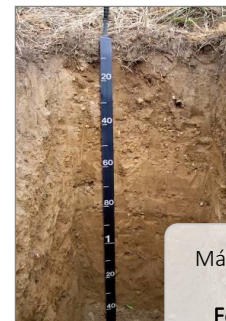
Más, jellegtelen talajok Földeskopár

Egyszerűsített, képes határozókulcs a diagnosztikus osztályozás típusaihoz