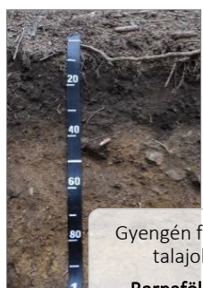
Gyengén fejlett talajok Barnaföldek