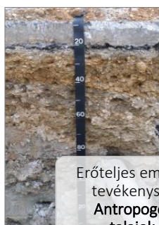
Erőteljes emberi tevékenység Antropogén talajok