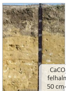
CaCO 3 > 25% felhalmozódás 50 cm-en belül Karbonát talajok