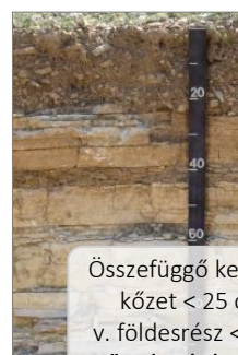
Összefüggő kemény kőzet < 25 cm, v. földesrész < 20% Közethatású talajok