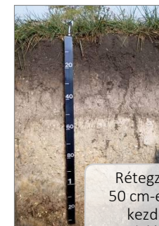
Rétegzettség 50 cm-en belül kezdődve Hordalék talajok