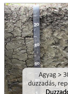
Agyag > 30% duzzadás, repedezés Duzzadó agyagtalajok