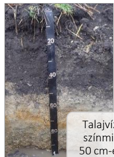
Talajvízglejes színmintázat 50 cm-en belül Réti talajok