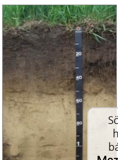
Sötét, mély, humuszos báziseltelt Mezőségi talajok