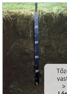
Tőzeg szint vastagsága > 40 cm Láptalajok