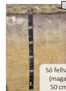
Só felhalmozódás (magas EC, pH) 50 cm-en belül Szoloncás talajok