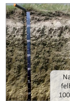
Na (ESP > 15) felhalmozódás 100 cm-en belül Szolonyec talajok