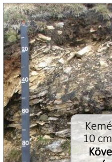
Kemény kőzet 10 cm-en belül Köves sziklás váltalajok