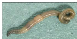
Zöld giliszta ( All. chlorotica )

Középmély járatokat készítenek (30-50 cm). A szerves anyagokat bekeverik a talajba, aprítják és felvehetővé teszik a további mikrobiális lebontásra (10-15 cm hosszúak).