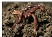
Trágyagiliszta ( Eisenia fetida )