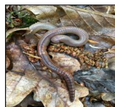
Közönséges földigiliszta ( Lumbricus terrestris )

Állandó, függőleges járatokat készítenek, 150-180 cm-es mélységig, javítják a víz beszivárgását. A növényi maradványokat leszállítják a mélyebb rétegekbe. Hosszuk 15-35 cm.